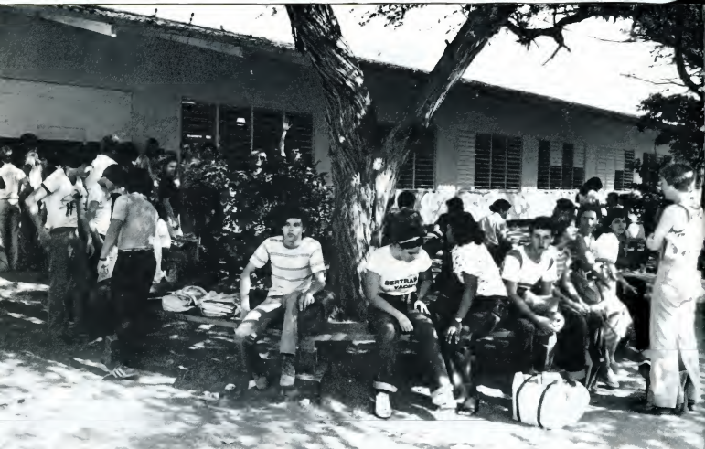
COLEGIO ARUBANO (S.M.O.A.): de enige school voor HAVO/VWO.